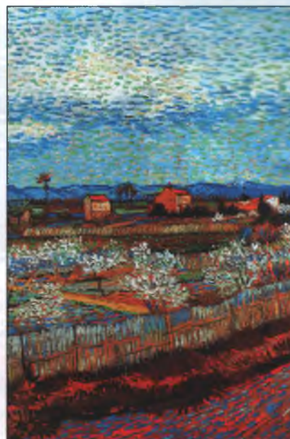
Винсент Ван Гог. Ла Кро и персики в цвету. 1889